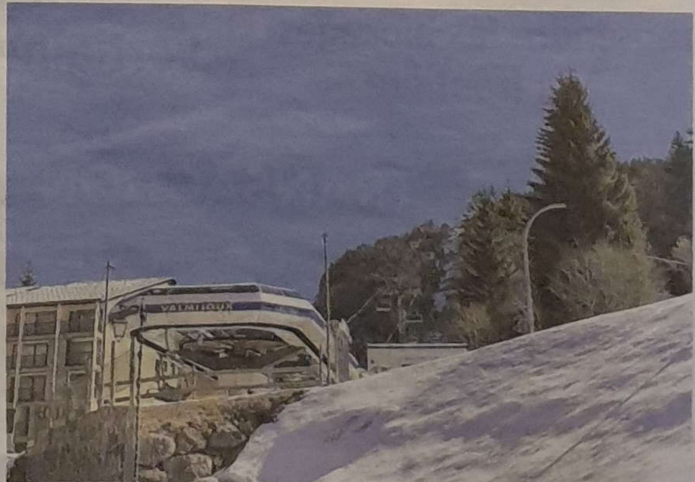
La tyrolienne sera parallèle au télésiège Val Mijoux.

« Ce sera forcément une activité déficitaire, souligne un autre commerçant. Ils sont actuellement en train de fermer des remontées mécaniques et ils vont en ouvrir une juste pour la tyrolienne ? Ils feraient mieux de se concentrer vraiment sur la saison hivernale, et qu'elle fonctionne vraiment, en proposant des tarifs corrects pour les forfaits de ski ou en installant des canons à neige... avant de vouloir proposer une offre quatre saisons. »