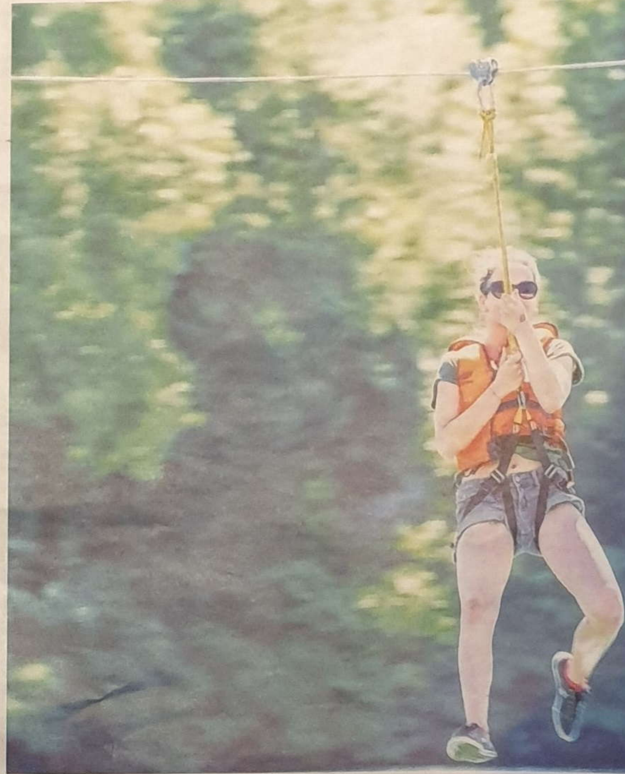
Prêt pour des sensations fortes ? (Photo d'illustration)

On n'écarte donc pas le principe d'un pass pour l'espace de jeux de la Faucille. « Tout est possible, l'offre de prix est à travailler. »